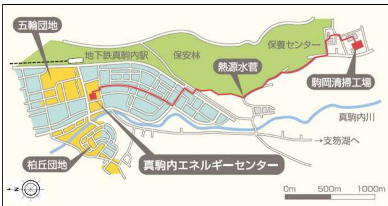
図 2.1 駒岡清掃工場の位置と地域熱供給事業

駒岡清掃工場は、地下鉄真駒内駅より約 3km 南に位置しています。駒岡清掃工場は、ごみ焼却により発生した余熱を工場内の冷暖房や給湯、保養センター駒岡の冷暖房、給湯、ロードヒーティング等に使用するほか、地下鉄真駒内駅前地区にある北海道地域暖房(株)真駒内エネルギーセンターへ供給しています。同社が行う地域熱供給事業により、真駒内地区の家庭や商業施設に利用されています。