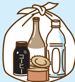
びん・缶・ペットボトル