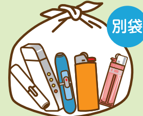
加熱式・電子たばこ、ライター