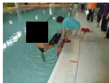
プール救難救命訓練