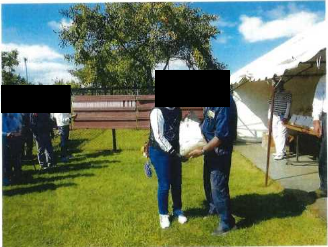
以下が大会入賞者の氏名とスコアー表です