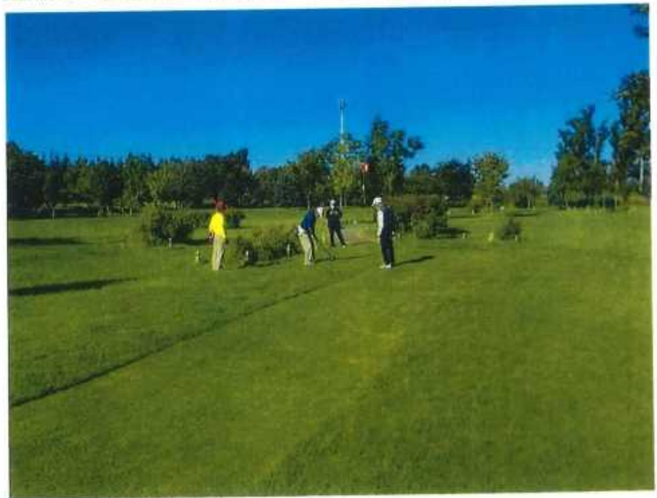
順位、スコア、氏名は以下の通りでした