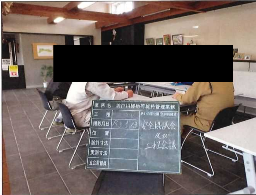
茨戸川緑地 安全協議会及び工程会議 茨戸川緑地管理事務所 2021年 5月13日