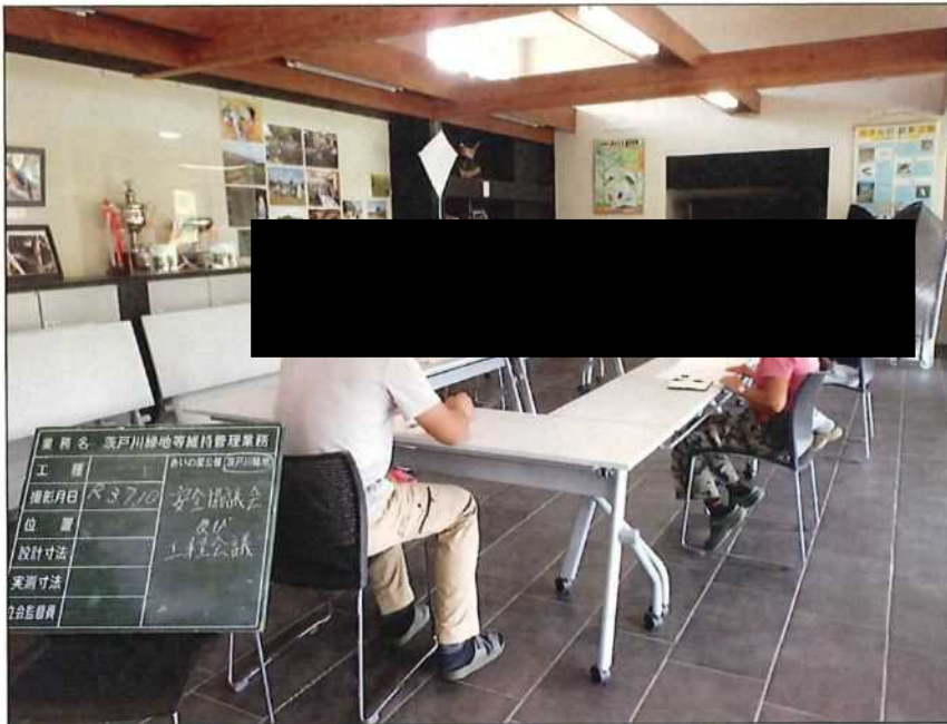
茨戸川緑地 安全協議会及び工程会議 茨戸川緑地管理事務所 2021年 7月10日