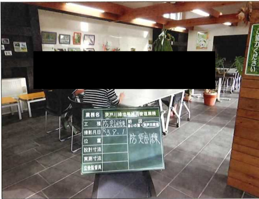
茨戸川緑地 防災訓練 茨戸川緑地管理事務所 2021年 9月 1日