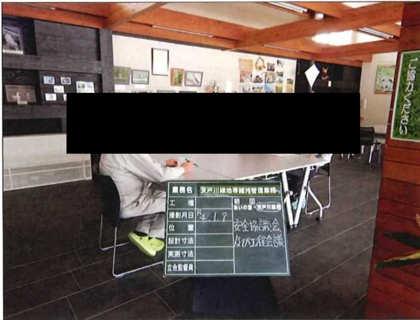
茨戸川緑地 安全協議会及び工程会議 茨戸川緑地管理事務所 2022年 1月 9日