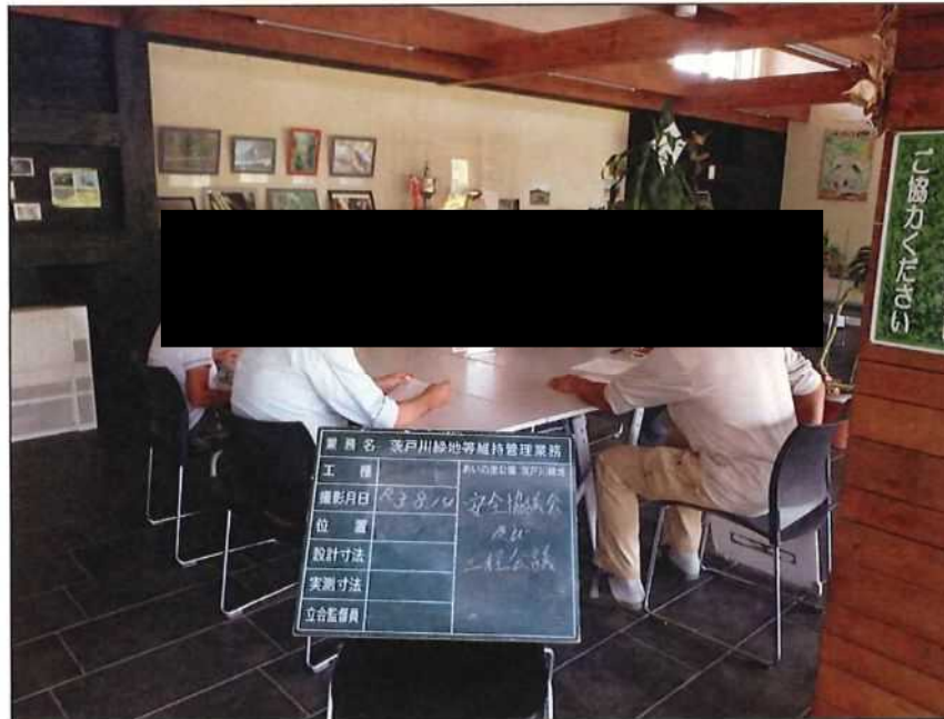
茨戸川緑地 安全協議会及び工程会議 茨戸川緑地管理事務所 2021年 8月13日