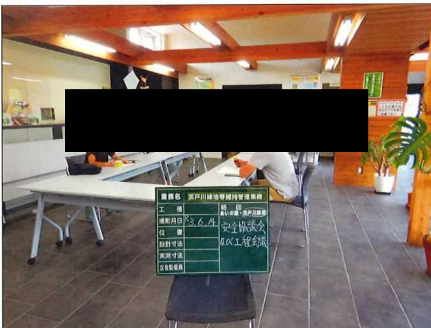
茨戸川緑地 安全協議会及び工程会議 茨戸川緑地管理事務所 2021年 6月14日