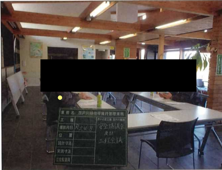
茨戸川緑地 安全協議会及び工程会議 茨戸川緑地管理事務所 2021年 4月 8日