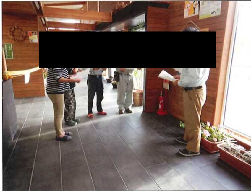
茨戸川緑地 防災訓練 茨戸川緑地管理事務所 2021年 9月 1日