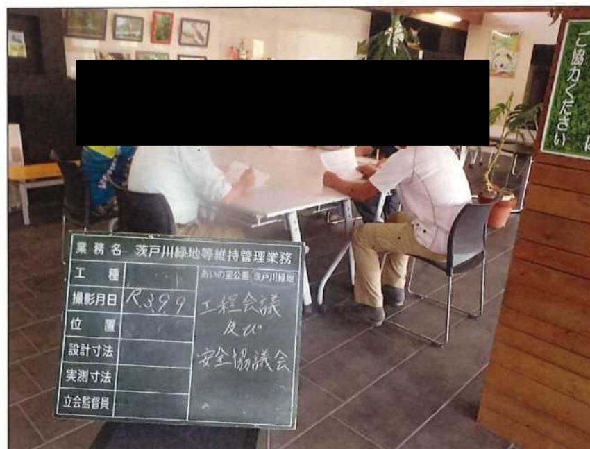
茨戸川緑地 安全協議会及び工程会議 茨戸川緑地管理事務所 2021年 9月 9日