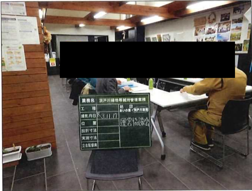
茨戸川緑地 運営協議委員会 茨戸川緑地管理事務所 2021年11月17日