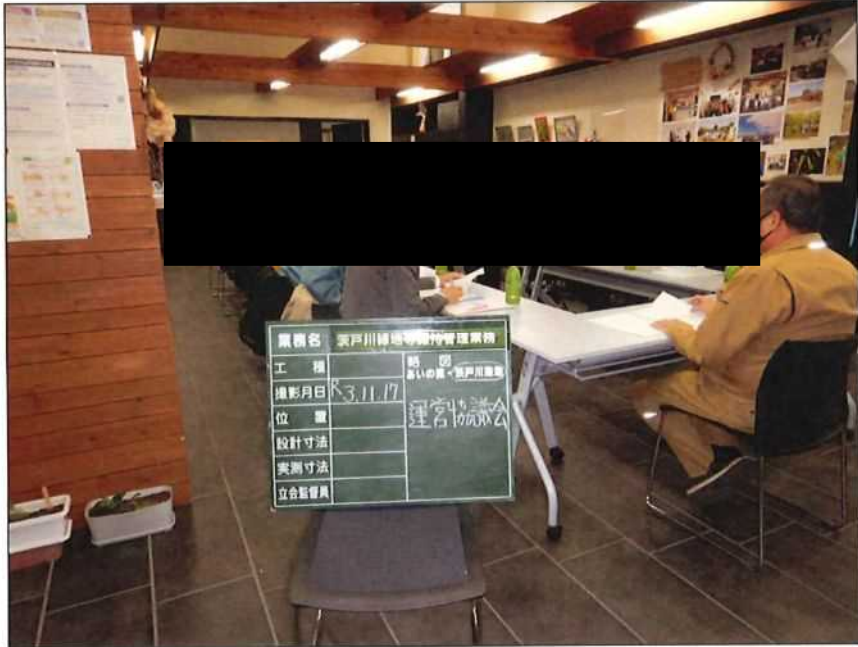
茨戸川緑地 運営協議委員会 茨戸川緑地管理事務所 2021年11月17日