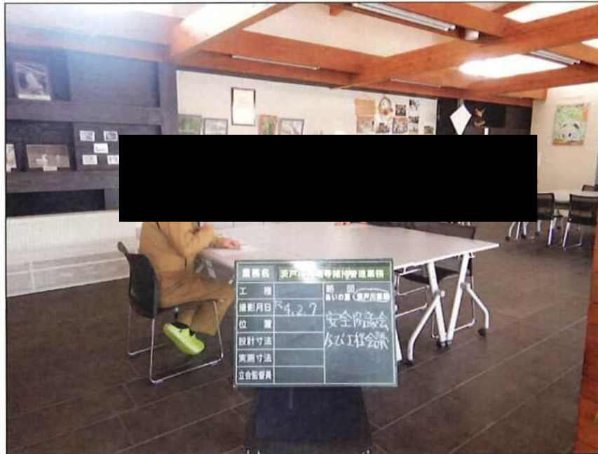
茨戸川緑地 安全協議会及び工程会議 茨戸川緑地管理事務所 2022年 2月 7日