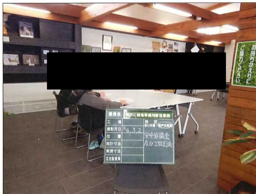
茨戸川緑地 安全協議会及び工程会議 茨戸川緑地管理事務所 2022年 3月 2日