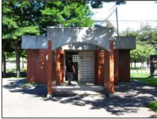
公衆トイレ（冬期間閉鎖）