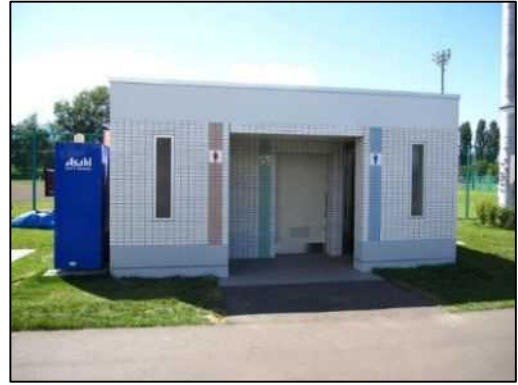
公衆トイレ（冬期間開放）