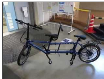
タンデム型自転車