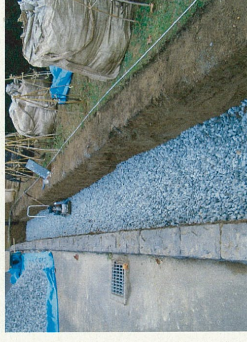
下部の単粒度砕石の施工状況