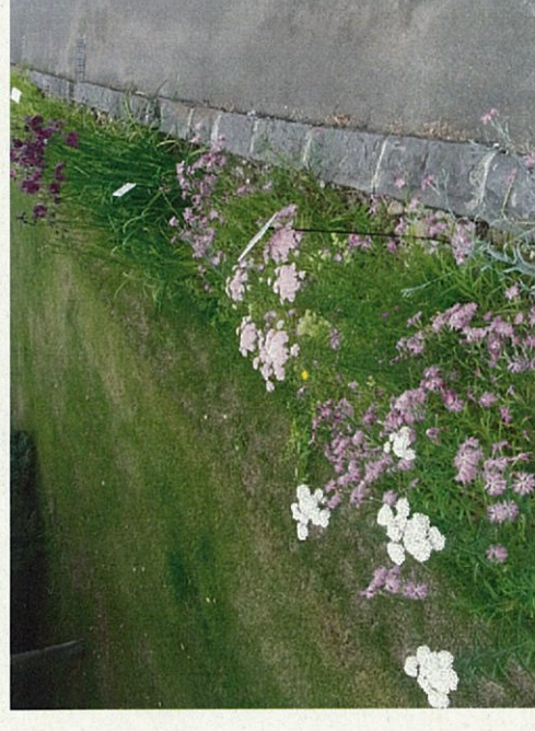
自生種のノハナショウブやエゾカワラナデシコが華やか