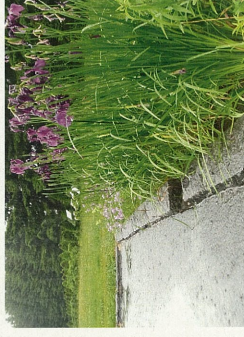
スリットから水が流れ込む