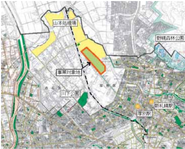
* (仮称)厚別山本公園位置図

札幌市では、山本処理場（厚別区厚別町山本）のうち、もっとも早くから埋め立てを行ってきた「山本地区（約52ha）」での埋め立て完了に伴い、この跡地に厚別区の総合公園となる「(仮称)厚別山本公園」の計画を進めています。