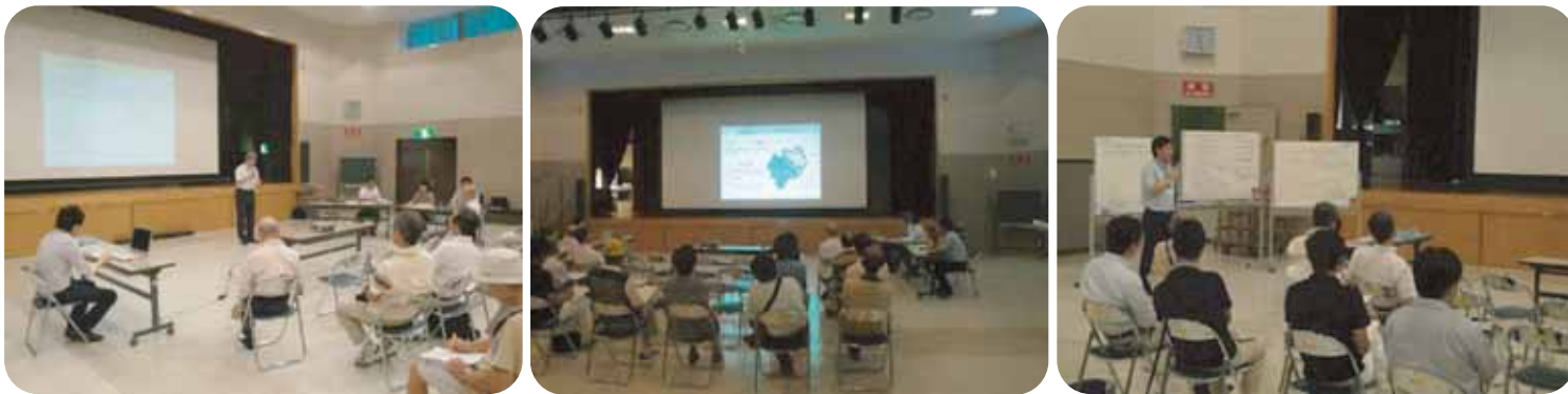
*市民説明会の様子

8月28日（土）に厚別区民センターで第1回市民説明会を開催しました。17名の方に参加して頂き、公園説明をパワーポイントを使って行いました。説明の後、カードに質問や要望を書いて頂き、その場で質問や要望の回答をいたしました。