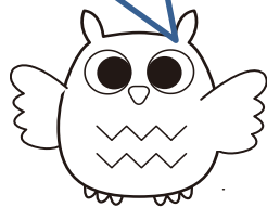
福まちのマスコット