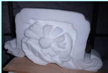
👉 屋根の上に乗せる部分

さっぽろ雪まつりは、子どもの頃には毎年のように出かけていきましたが、学生、そして社会人へと成長するとともに、だんだんと足が遠のいてしまっていたというのが実情です。