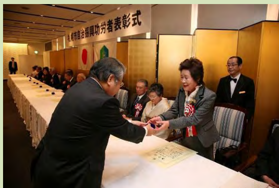
👏 表彰式の様子です。おめでとうございます！