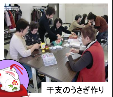
干支のうさぎ作り