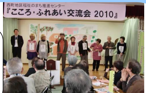
介護予防劇・落語も大好評でした