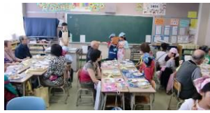
小学生と昔遊び・給食も一緒に楽しみました