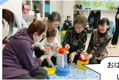
高齢者も参加しての楽しい時間