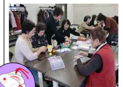
干支のうさぎ作り