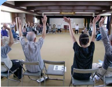
年 2 回 8 会場開催