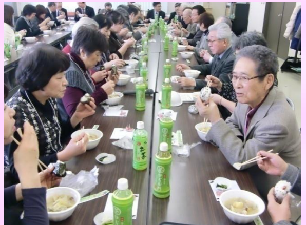
ボランティアさんの作った食事を食べながら交流も

高齢者のために各地区で作成が進む「緊急連絡カード」は、高齢者の掛かり付け医や血液型、緊急連絡先などが記されていて、町内会役員などが保管、もしものときの連絡に使用するというもの。西町地区では、地区内の高齢者に調査票を配り、その回答率が100%だったことが報告されると、清田中央地区からは驚きの声が上がりました。その際のエピソードとして西町地区から「見守り活動で訪問しても全然会ってくれないような人でも、郵便受けに調査票を入れておいたらきちんと回答が来た。積極的な関与を嫌う人であっても生活への不安は皆同じ。電気が付いているかななどを外から確認する『さりげない見守り』活動の大切さを再確認した」などの話がありました。