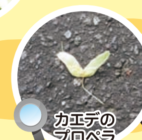
カエデの プロペラ