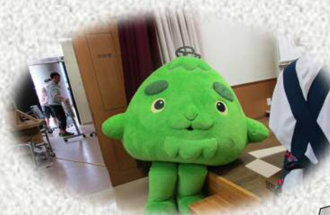
ステージ脇に座り込んで一休み

でも、この時まちセン所長の姿が見当たらない・・・、所長はどこへ行っちゃったの・・・と関係者はやきもきしたそうです。