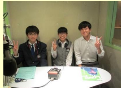
無事終わりにっこり。パーソナリティーと記念撮影