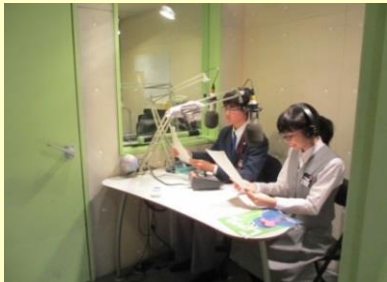
ちょっと緊張。収録中！

三角山放送「私たちのエコ・まちライフ」に八軒東中学校が登場しました。生徒会事務局員2名がパーソナリティーと対談し、中学校の紹介や1年を通じて様々なボランティアに取り組んでいることなどを電波に乗せて届けました。毎年6月に実施しているゴミ拾いボランティアは、200名以上の生徒さんが参加するそうです。『これからも積極的にボランティアに取り組みたい』と力強くエコまちを宣言しました。