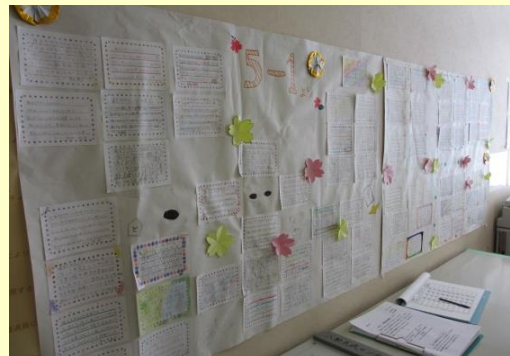
お礼の手紙。福まちに掲示してあります。