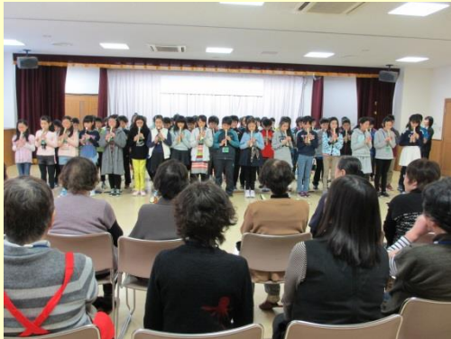
リコーダー演奏「花束を君に」

当日はゲームや昔遊びを一緒に楽しみ、子ども達から、八軒地区の良いところや昔の生活、健康の秘訣などのインタビューもありました。