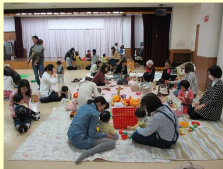
2月は大賑わい！親子で57名参加

お誕生月のお子さんには親子写真をプレゼント。どなたでも参加できますので、ぜひ遊びに来てください。