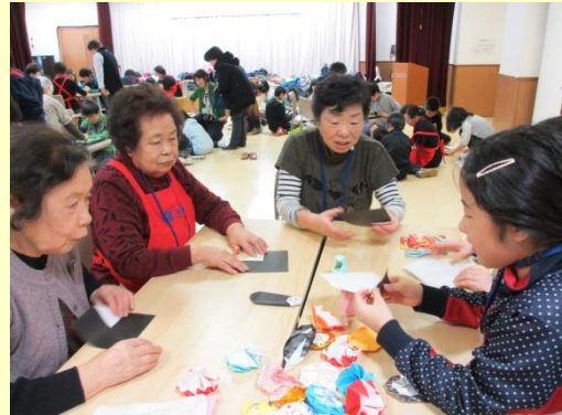
グループに分かれて様々な遊びで交流しました。