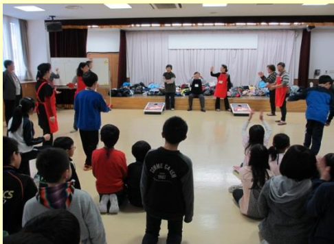
クラス対抗バグゴ大会で盛り上がりました！