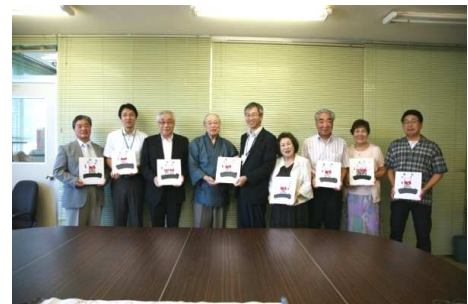
西区長（中央）寄贈後に記念撮影