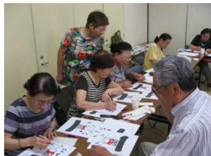
約40人の皆さんが参加