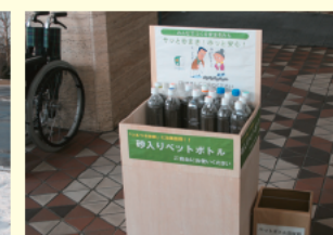
区役所ではペットボトル入りの砂も配布しています