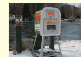
箱の中にある砂袋を誰でも自由に使えます

冬は路面がツルツルになることがしばしばあります。そこで活躍するのが砂。交差点や坂道などには「砂箱」が設置されているので、「滑って危ないな」と感じたら自由にふたを開けて、砂をまきましょう!