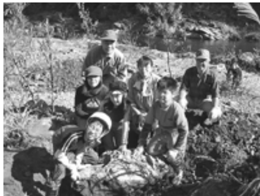
写真：クジラ化石の発掘調査 (2010年10月24日)

化石が発見され、発掘され、博物館へ持ちこまれ、クリーニングされて、博物館に標本として収蔵されるまでをレポートします。