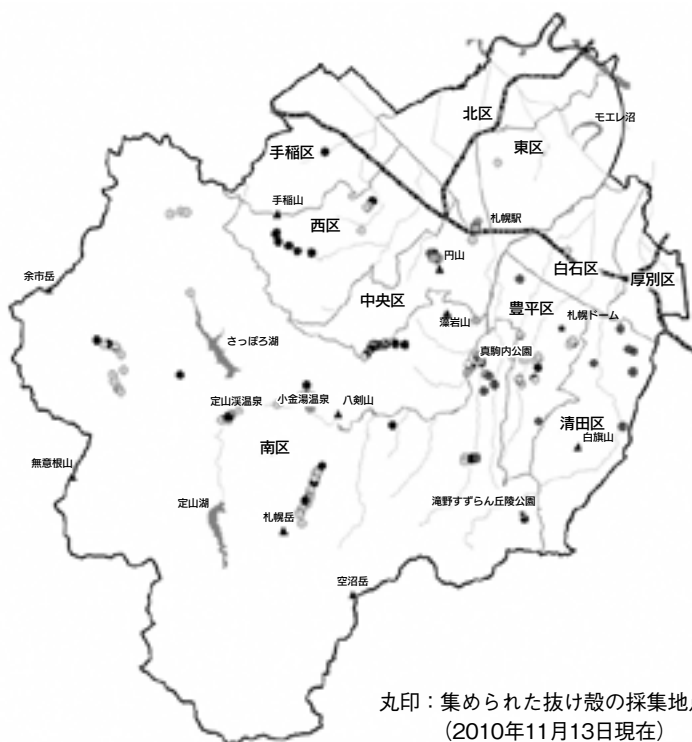
丸印：集められた抜け殻の採集地点 (2010年11月13日現在)