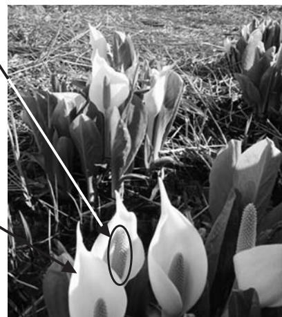
ザゼンソウ（5月中旬、沼田町）