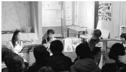
絵本にあわせて演奏も行いました。