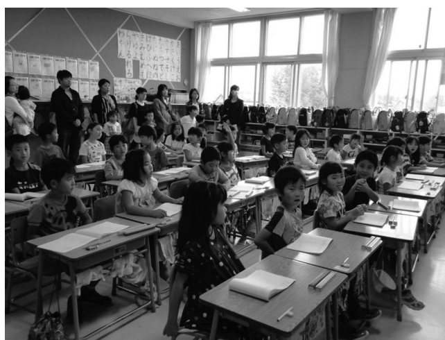
算数のたしざんの授業風景