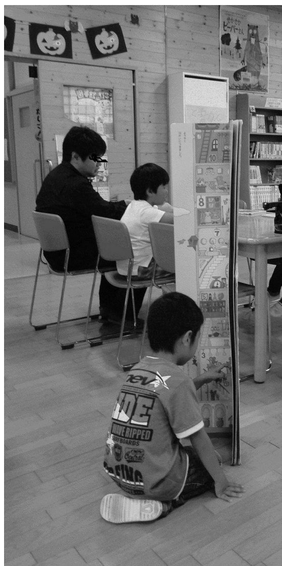
大きな絵本を夢中に読む園児

すべての見学が終わったら、体育館に戻り保護者に以下のようなアンケートを記入してもらい、50枚の回答が得られた。