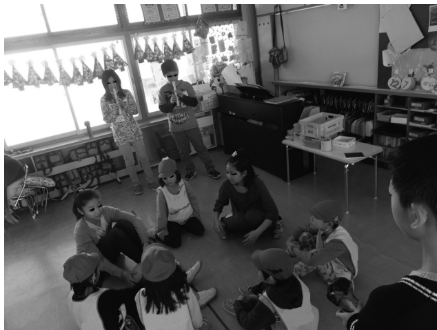
リコーダーを使って園児とゲームをする

来年度は、新6年生と新1年生という関係になり、校内でも関わりが増えていくことになるので、この学習の成果を生かしてほしいと願っている