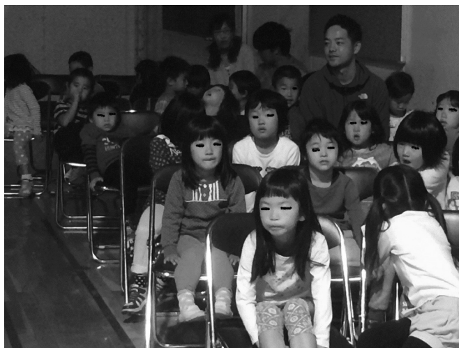
小学生の発表を観覧する園児