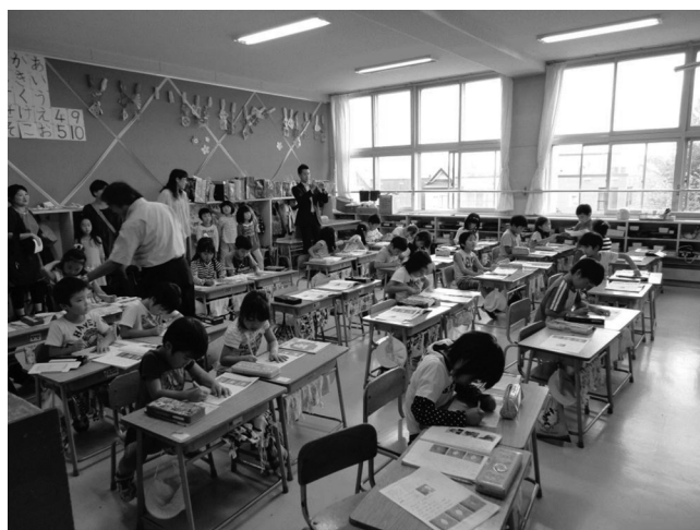
国語の読み取りの授業風景

参加者が予想を上回ったため、急遽多目的室から体育館に変更し、趣旨説明を行った。今回は1年生の授業参観をメインとするが、1年生教室横には地域開放図書館が開館していて自由に見学できること、また1年生以外のすべての教室も公開し、普段の学習の様子を見学してほしいこと、保護者と一緒に学校中を探検してほしいことを確認した。見学後には体育館に戻りアンケートの記入を依頼した。