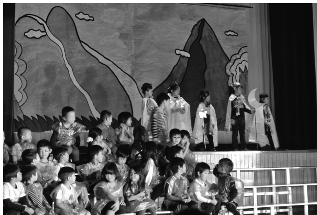
学習発表会 1年生の演技

このように継続的に顔の見える職員間の交流を行うことは、連携における最大の武器となる。新入生に関する情報交流やお互いの取組の共有など、太いパイプによるしっかりした連携が可能となり、保護者の安心感を支えている。