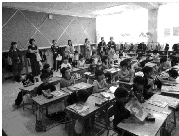
学校公開日の公開授業の様子

4月28日に保護者への案内状と園長先生への依頼状を、それぞれの園に直接持参することにした。年度始めのご挨拶も兼ねての訪問だった。直接、園の先生にお会いして文書を渡す時に、「○○ちゃんは元気にやっていますか?」「要録は活用されていますか?」など何気ない会話の中にも、連携に関する話題が自然と出てきて、直接持参することの大切さと、幼保小連携とは、このような小さなことから始まるものだと感じた。