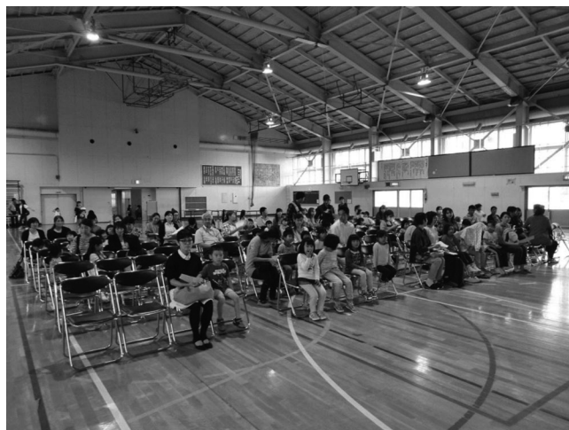
体育館での趣旨説明の様子

幼保小連携事業のメインとなる就学前園児・保護者学習参観を9月28日に行った。今回の案内も、近隣17の幼稚園・保育園に持参し、事前に参加申し込みを返信していただくようにした。50組の園児と保護者の申し込みがあり、100名以上の参加者があった。