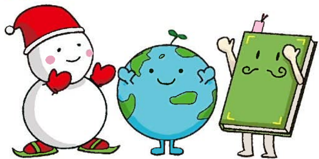
ゆっぽろ ちっきゅん おっほん