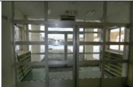
1階3年生教室前のグラウンド玄関。夏は一輪車と竹馬、冬は1・2年生のスキー置き場でした。