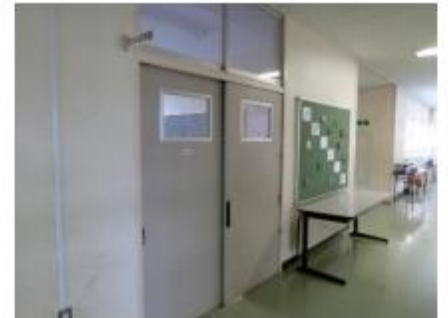
2019年に PTA 室を改築し「わかば学級」が誕生しました。