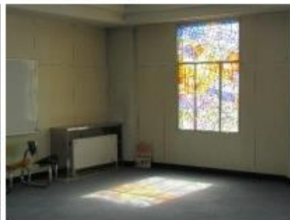
2階ステンドグラス「都市」図書室(もと多目的スペース)