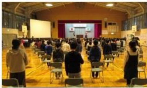
ソーシャルディスタンスを保っての閉校式

2月19日（金）に行われた閉校式の様子を紹介します。大変残念なことに、多くの方をお呼びすることができず、札幌市教育委員会教育次長、PTA 会長と児童と教職員のみでの開催となりました