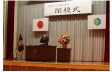
札幌市教育委員会 教育次長挨拶