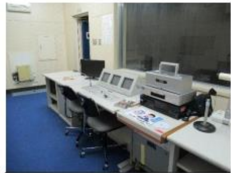
2階 放送室 放送委員が入れる特別な場所だ でした。途中でテレビが薄くなりま した。