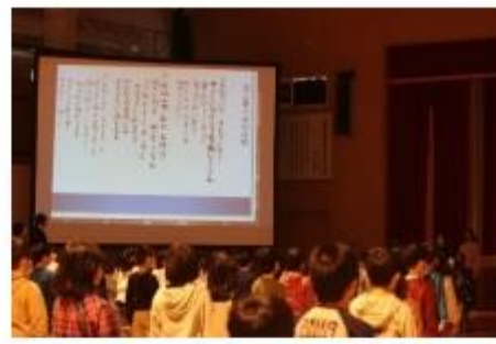
校歌斉唱 歌詞は6年生が一字一字書いた 寄せ書きです。