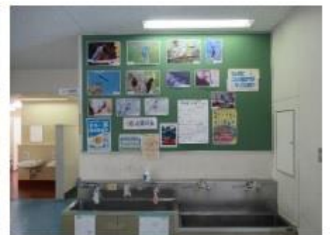
コロナ対策のため、手作りのレバーを付け、一つ置きに使っていました。