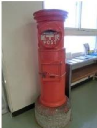
昔懐かしのポスト 1階玄関ホールにありま した