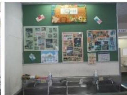
水飲み場 野鳥の写真やスポーツチームのポスターなどがありました。