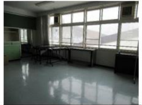
3階 音楽室 歌や器楽だけでなくダンスの練 習などでもできる広さでした。