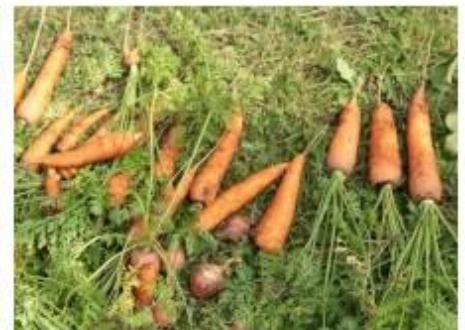
にんじんの収穫 年によって収穫量や形に大きな差の出る野菜でした。