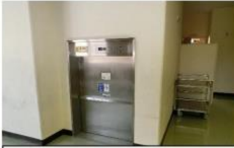
毎日おいしい給食を運んでくれたダムウォーター