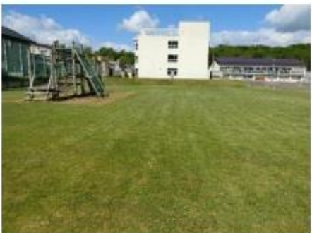
石山東と言えば・・・芝生です。 グリーントイムの雑草取りは、子どもたちも好きな時間でした。