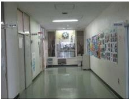
2階 校長室と職員室への廊下 ちょっと緊張する空間？