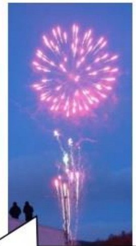
夜は町内会による花火の打ち上げまでありました！