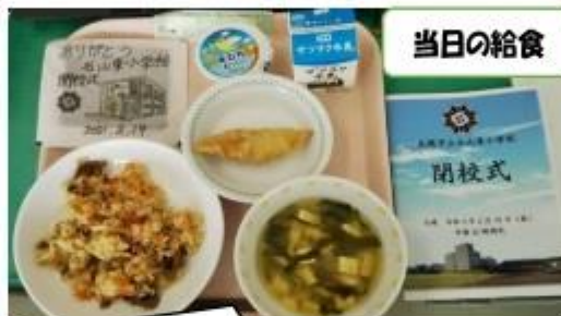
当日の給食 児童のイラスト付きの海苔がつきました