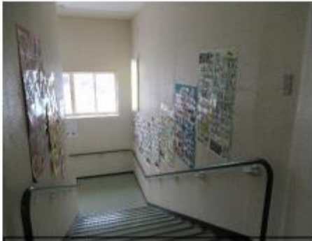
階段 左右の壁には35年分の思い出の 写真がぎっしり。