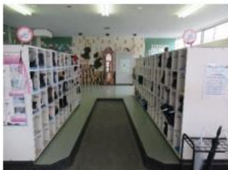
玄関 ここから一日が始まります