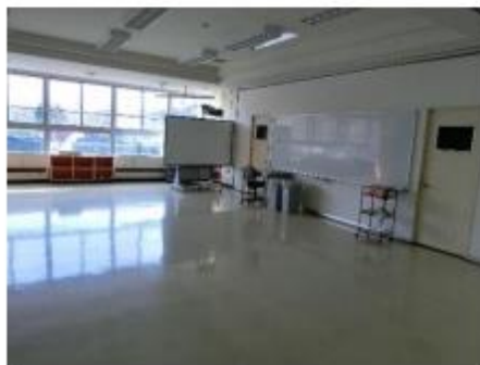
3階 ランチルーム 廊下と教室の間の壁を動かし、 フリースペースにもなりました。 た。