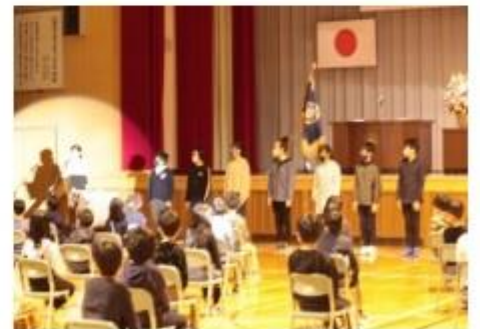
児童によるお別れセレモニー