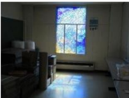
3階ステンドグラス「銀河」PTA室(もと図工室・読書室)