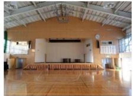
市内の小学校では珍しく、休み時間もボール遊びができた体育館