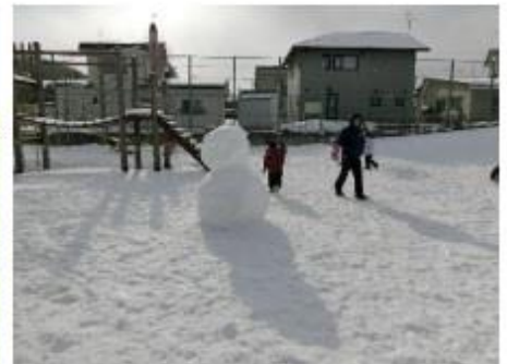
冬のグラウンド ホワイトタイムでは全校で外遊びを楽しみました。