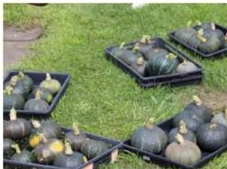
かぼちゃの収穫 一番多く収穫できる人気の野菜でした。