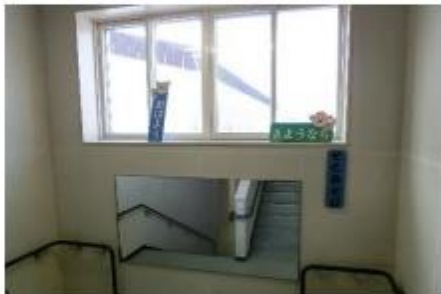
階段の踊り場にある「そとあそび」「うちあそび」「しばふあそび」の表示をみて一喜一憂していました。