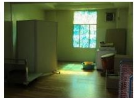
1階ステンドグラス「海洋」見つめる広場(もと多目的スペース)