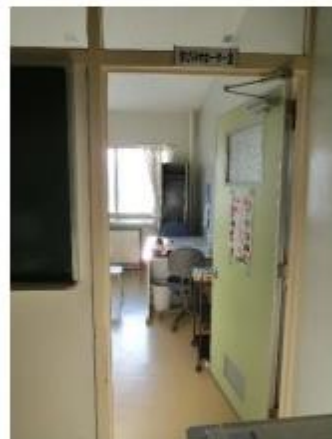
3階コンピュータ室の奥にあった「学びのサポーター」のお部屋。折り紙やお絵かきを楽しみました。