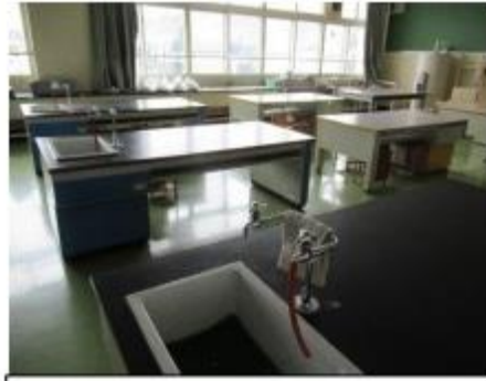
3階 理科室兼家庭科室 2種類のテーブルがある不思議 なお部屋でした。