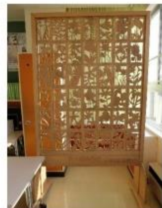
第6回卒業制作の衝立