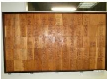
第4回卒業制作の校歌の歌詞