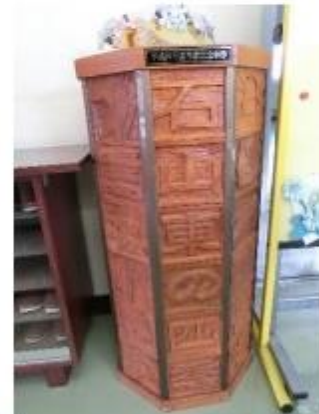
第11回卒業制作の花台