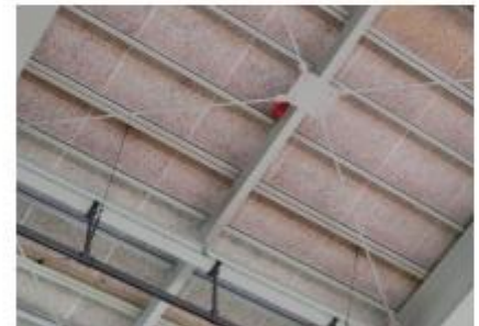
体育館の天井にはいろいろなボールが挟まっていましたね・・・