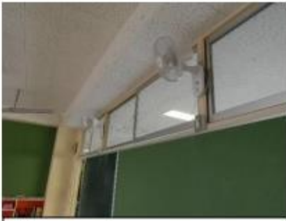
2019年サーキュレーターが各教室につきました。暑い夏も快適でした