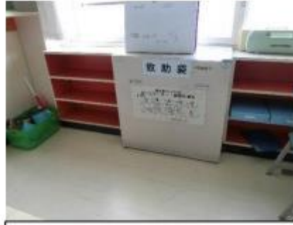
3階5年生教室といえば・・・中が見たくて仕方なかった救助袋です。