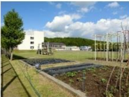
ふれあい農園 3年ほど前から学年園すべてが農園となりました。