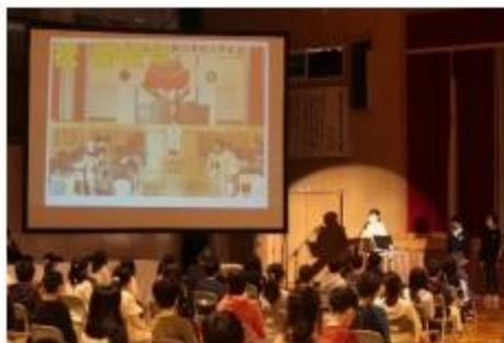
スライドで振り返る 石山東小学校の35年間