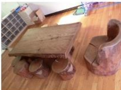
見つめる広場のテーブルと椅子・・・ここで、トランプやオ セロをしていましたね。