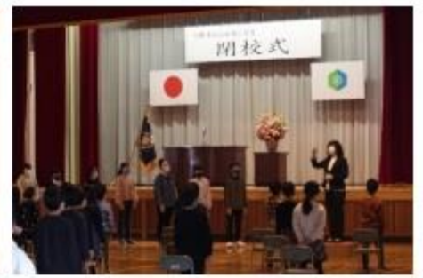
全校合唱 「地球星歌～笑顔のために～」 感動的な歌声でした！