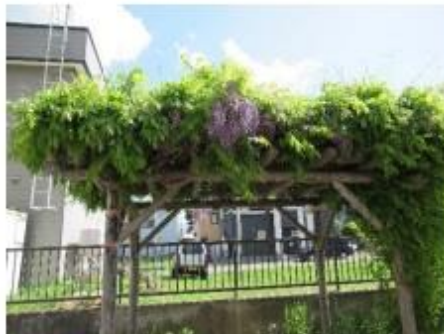
藤棚、以前はこの下に金魚を飼っていた時期があったようです。