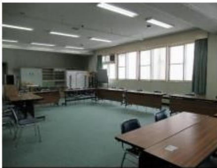
2階 視聴覚室 会議が行われたり、グループ活動 の場にもなりました。