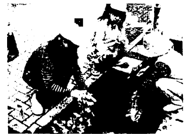
地域の方と一緒に花壇整備（6年）