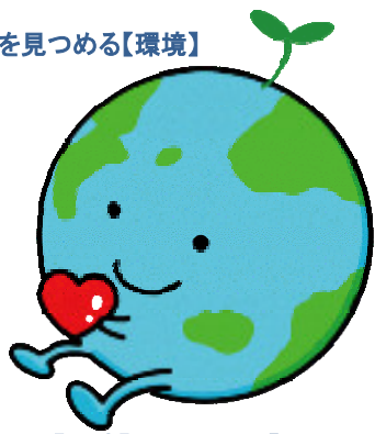
【環境】キャラクター「ちっきゅん」