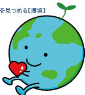
【環境】キャラクター「ちっきゅん」