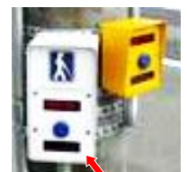
青の時間が長くなる信号機

(3) お年よりや体の不自由な人たちが安心して外を歩くことができるように、右の写真のようないろいろな交通安全しせつがあります。自分の住む地いきにどのような交通安全しせつがあるか、調べてみましょう。