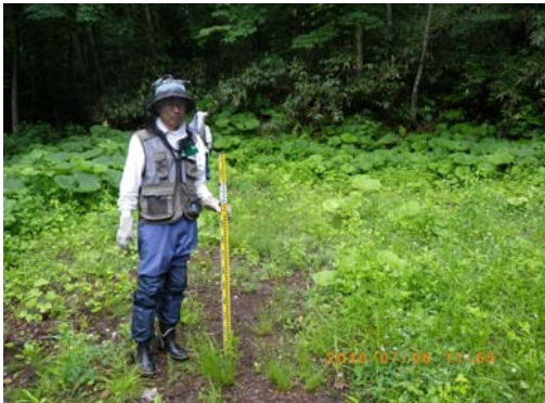
設置場所周辺環境