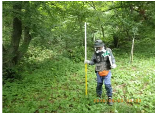
設置場所周辺環境