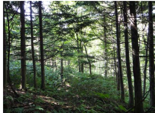
設置場所周辺環境