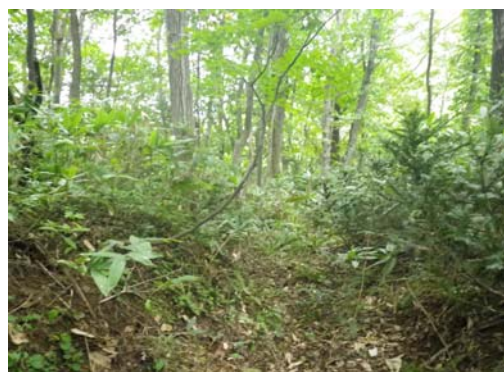
設置場所周辺環境