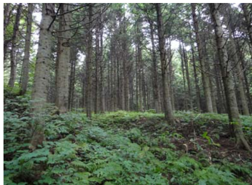
設置場所周辺環境