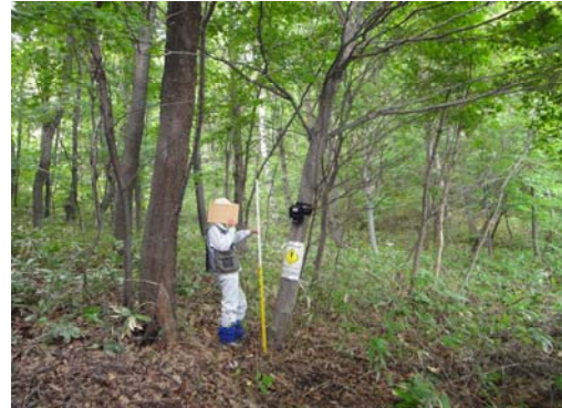
設置場所周辺環境