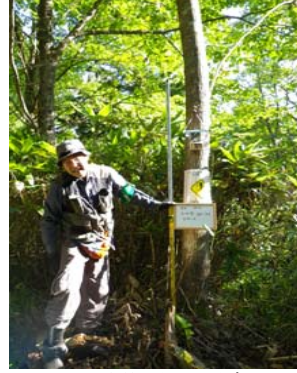
設置場所周辺環境