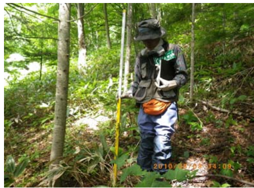
設置場所周辺環境