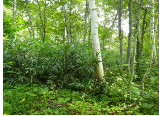
設置場所周辺環境