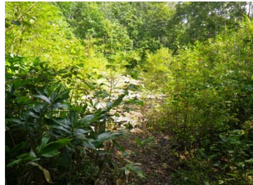
設置場所周辺環境