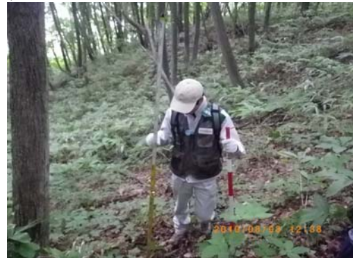
設置場所周辺環境