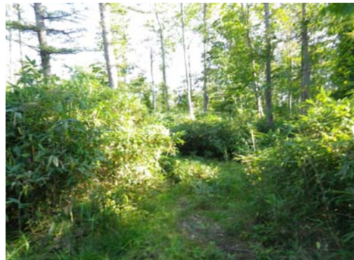
設置場所周辺環境