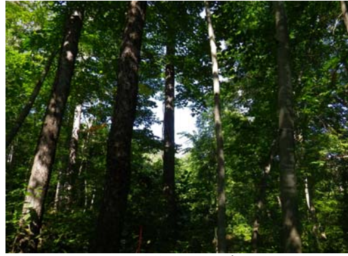
設置場所周辺環境