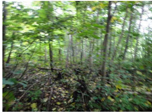
設置場所周辺環境