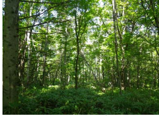
設置場所周辺環境