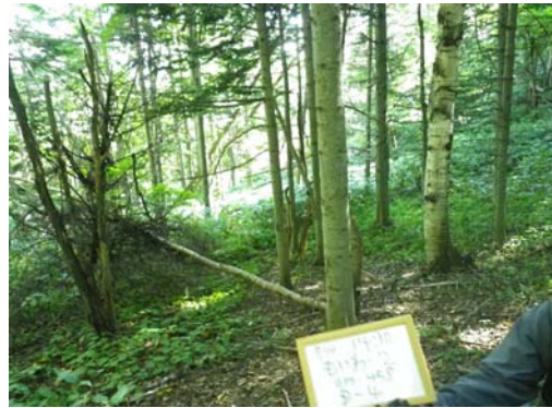
設置場所周辺環境