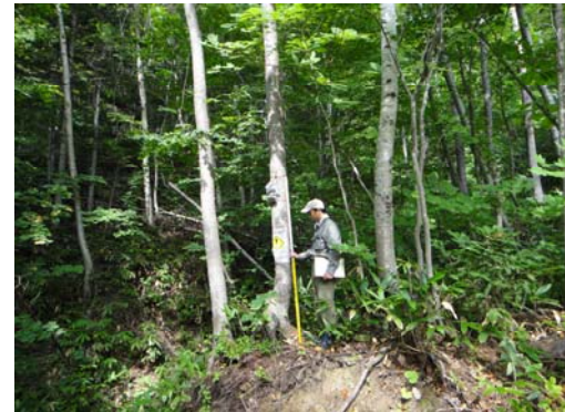
設置場所周辺環境