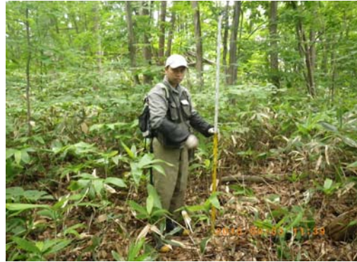
設置場所周辺環境