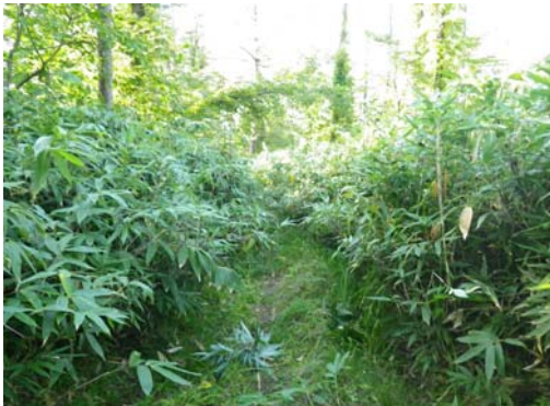
設置場所周辺環境