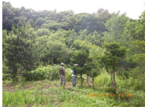
設置場所周辺環境