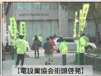
【電設業協会街頭啓発】