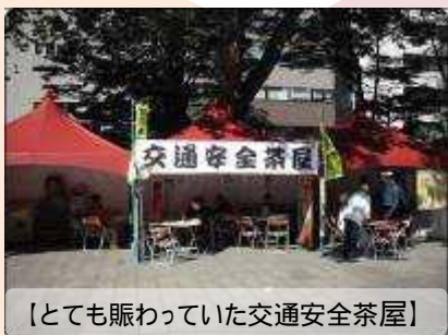
【とても賑わっていた交通安全茶屋】

「オータムフェスト」大通公園4丁目会場内において、交通安全を呼びかける「交通安全茶屋」を設置し、関係機関と協力し、街頭啓発を実施しました。来場した市民に「交通安全の一言アドバイス」や夜光反射材を配布し、交通安全意識の高揚を図りました。