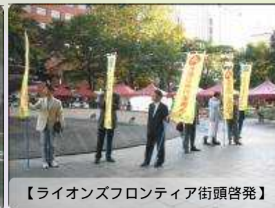
【ライオンズフロンティア街頭啓発】