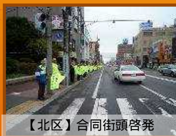
【北区】合同街頭啓発

「オータムフェスト」大通公園4丁目会場内において、交通安全を呼びかける「交通安全茶屋」を設置し、関係機関と協力し、街頭啓発を実施しました。来場した市民に「交通安全の一言アドバイス」や夜光反射材を配布し、交通安全意識の高揚を図りました。