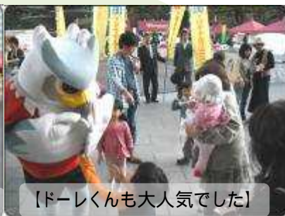
【ドーレくんも大人気でした】