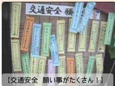
【交通安全 願い事がたくさん！】

その思いも通じ、当日の交通死亡事故発生は市内・道内とも0件という素晴らしい結果となりました。