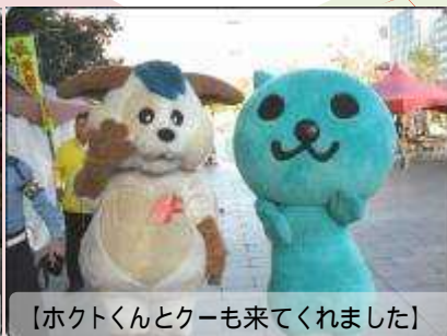
【ホクトくんとクーも来てくれました】