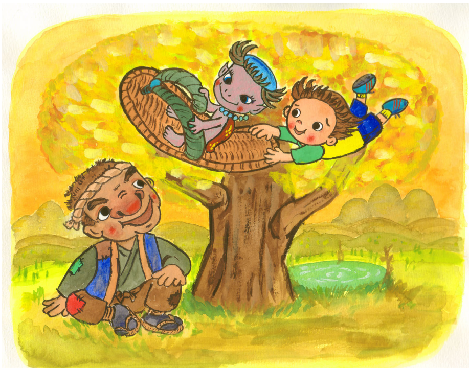
子どもの権利条約啓発人形劇「リュウタとポチャとクルミの木」