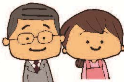
「きらり君」の保護者 (「KenriBook」より)

※ 条例とは、市議会で制定する市のきまりです。「子どもの権利条例」の正式名称は、「札幌市子どもの最善の利益を実現するための権利条例」といいます。