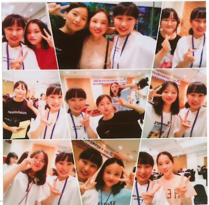
↑ セサ作らパーティーでの写真

この事業に参加して韓国という国について普通の旅行じゃ知り得ない色々な多くのことをホームステイを通して学ぶことができました。そして私がこのように成長することができたのは両親、この事業に関わってくれた引率の方、通訳の方などたくさんの方のおかげだと思っています。協力してくれた全ての方に感謝を伝えたいです。