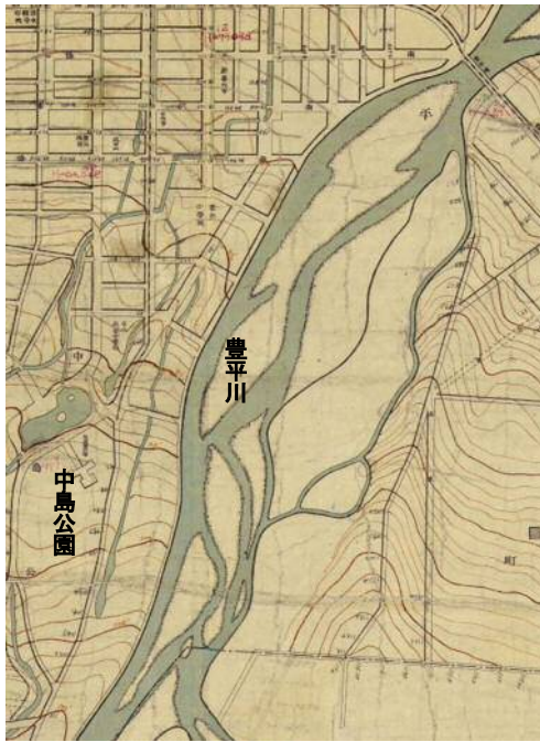
【図4】 豊平川両岸の自然堤防

が推察される。さらに左岸側は等高線のふくらみが川から離れて北に向かっている。この右岸から続く微高地は以前繋がっていた自然堤防であり、札幌川は豊平橋辺りから北への流れが、一条橋の西岸近辺の等高線が南へへこんだ部分を通りその北方へ延びていたことが推察される。つまり一条橋の下には川がなかった。札幌川は19世紀初頭に大氾濫により以前あった自然堤防を破壊して江別方面へ流れる今の河道に変わった(『新札幌市史』第1巻p484)。図4で示す右岸の自然堤防は豊平橋の南側から一条橋辺り迄見えないが、この自然堤防は上記の左岸に突き出た自然堤防に繋がっていたが、その氾濫の時に破壊された自然堤防であろう。