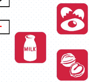
アレルギー原因食品 ピクトグラム（絵文字）