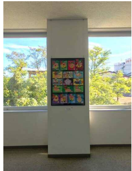
(天井にピクチャーレールを設置)