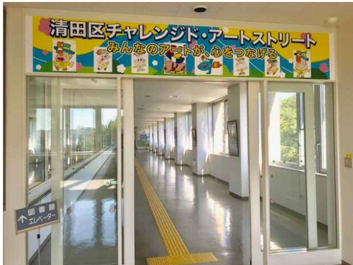
【アートギャラリーの着板と全景】