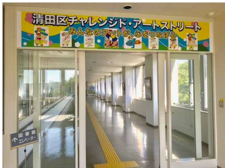
【アートギャラリーの看板と全景】