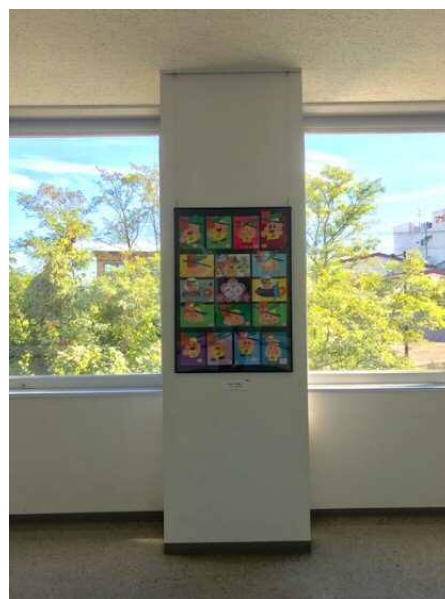
(天井にピクチャーレールを設置)