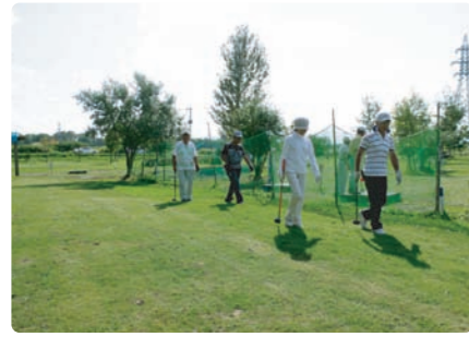
東屯田川遊水地コース