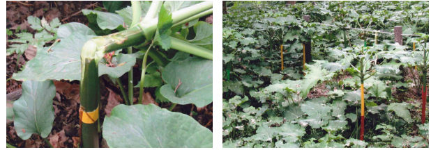
カラスによる被害と茎にテープを巻いたところ

赤・黄・黒等のビニールテープを巻き保護策を講じてきました (今年は 82 本に)。今後も専門家の指導を得て、北区土木部と協調し現状の生態を維持すべく保護策に力を入れていきます。