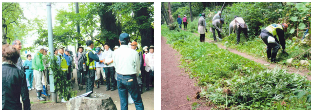
駆除作業の様子 (ミーティングと作業風景)

明年引き続き実施することで「オオハンゴンソウ」の撲滅も、この屯田防風林を守る重要な作業と思っています。