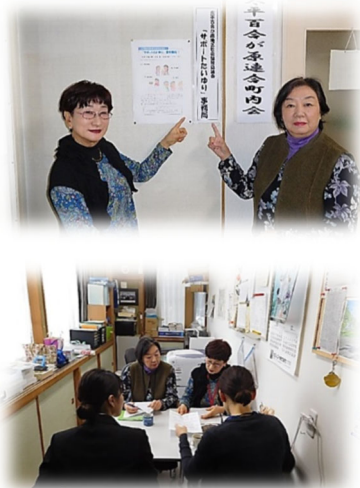
【開設初日事務局の様子】

開局間もなく、太平の住民から雪対策用に窓に木枠を取り付ける作業の依頼を電話で受け付けました。早速、協力会員2名で依頼者宅に伺い、簡単な作業を済ませて感謝されました。