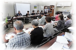
【協力会員全体会議の様子】

事務室の当番は地区社協理事全員で引き受けることになりました。まずは毎週水曜日の午後2