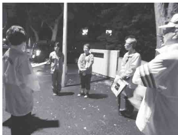
公園パトロールの様子