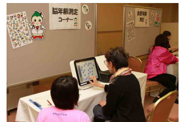
健康イベントの様子

また、同時開催しておりました健康イベントにも、多くの方々にご来場いただき、特に血管年齢測定や脳年齢測定ブースには、測定を希望される方が多く並び、大盛況となりました。