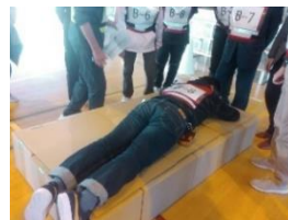
去年の訓練の様子