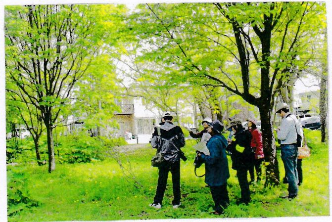
2014年春の自然観察会

環境アドバイザー講師による大好評の観察会です 季節の草花 樹木 野鳥など 楽しみが多いのですが 講師の話は楽しいです!