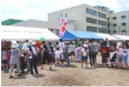
縁日市に並ぶ様子