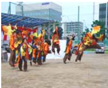
よさこい「縁」の踊り