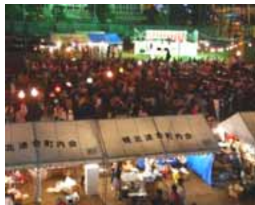
夜も大勢の人で賑わっている様子