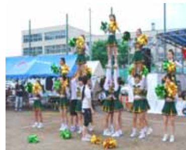
チアリーディングの演技