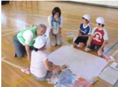
マップ作りをする地域の方と子どもたち

25日は体育館で、グループごとに現地調査で確認してきたことを、判りやすく色分けしたり、写真を貼るなど、工夫しながらみんな一生懸命に地域安全マップを作りました。