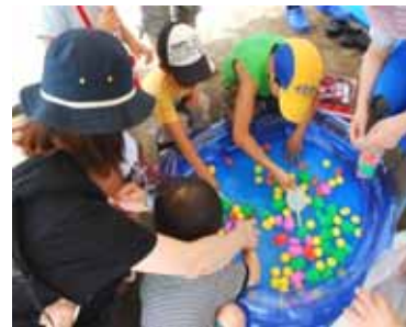
スパボールすくいを楽しむ子どもたち