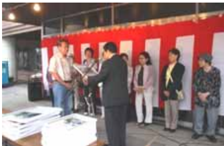
ガーデニングコンテスト表彰式の様子

審査は6月28日(月)に行われ、7月30日(金)ノースロード24フェスタ(夏祭り)の場で、表彰式が行われました。