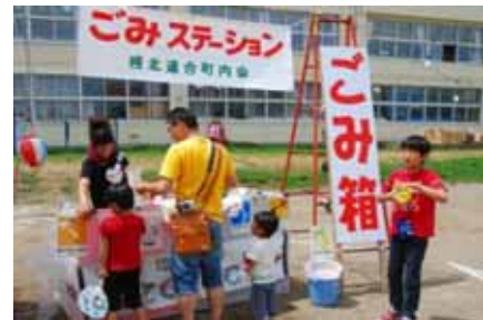
リサイクルを意識したごみ分別の様子

その他、廃食油を使ったキャンドル作り体験コーナーや子ども縁日、夜の花火大会など、子どもから大人まで楽しんでいました。