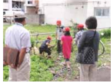
現地調査をする地域の方と子どもたち

23日はいくつかのグループに分かれ、「安全な場所」と「危険な場所」の違いを自分たちの目で確かめる現地調査を行いました。