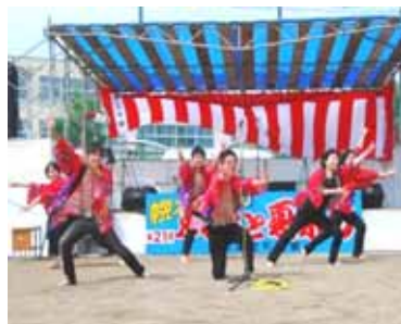
北大サークル「ハンサイ魂」の踊り