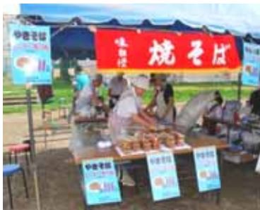
縁日市の食べ物コーナーの一つ