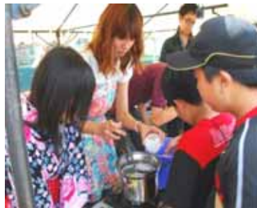
廃食油を使ったキャンドル作り