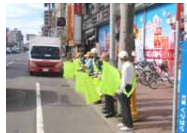
交通安全を呼びかけている様子