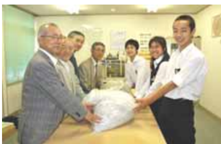
贈呈式の様子(左:地域・右:生徒)

7月7日(水)幌北まちづくりセンターで北辰中学校生徒代表3名に、地域の代表からリングプルを贈呈しました。