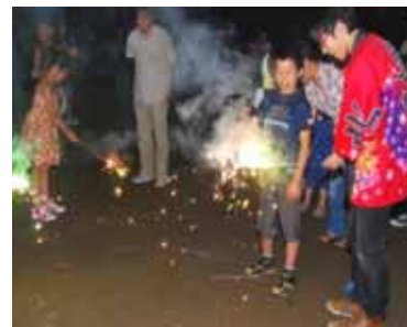
花火を楽しむ子どもたち