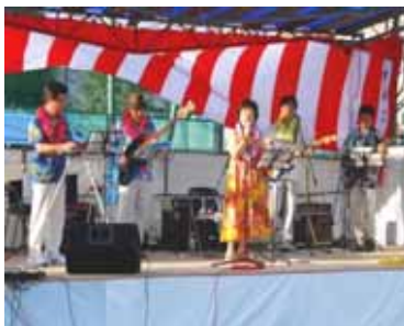
ハワイアンバンドの演奏