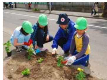
グループごとに協力して花植えをする様子