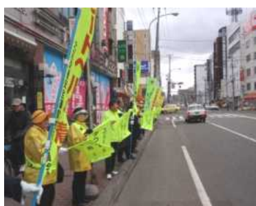
交通安全を呼びかけている様子

4月7日（水）午後2時から、西5丁目・樽川通及び宮の森・北24条通周辺で「春の交通安全合同街頭啓発」を行いました。