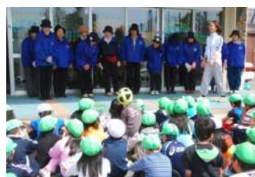
児童たちがお礼を述べる様子

最初に、分団員の方が花の特徴や上手な植え方について説明をし、その後3~4人のグループに分かれて作業をしました。