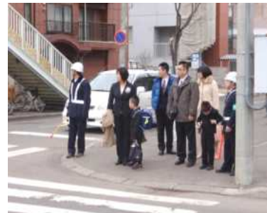
児童たちの安全を見守る様子