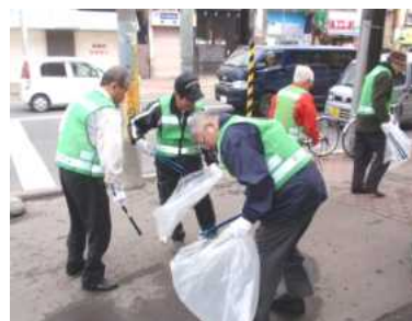
ごみを拾い集める参加者

この日は、天候にも恵まれ、スローライフ・イン・に～よん実行委員会の構成団体（北24条商店街振興組合、北区料飲店協会、幌北・北両連合町内会）約120人が参加し、約40分の作業で、ごみ袋10個分のごみが集まりました。