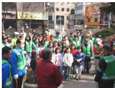
清掃活動前のセレモニー

4月25日（日）午前9時から、宮の森・北24条通（西2～8丁目）で、「北区アダプト・プログラム事業」の一環として清掃活動を行いました。