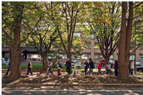
北大イチョウ並木の下をあるきました

自然豊かな構内の色付き始めた木々の葉を見ながら、北大構内の見所であるイチョウ並木やサクシュコトニ川を約1時間30分でまわり、児童、学生、地域の方々約170人が楽しくおしゃべりしながらウォーキングをし、心も体も健康的な一日を過ごしました。