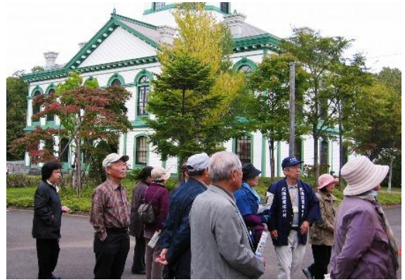
北海道の歴史に触れて

この施設は、明治・大正期の建築物を再現した野外博物館で、ガイドさんの建築物の説明や当時の暮らしぶりのお話に耳をかたむけ、歴史散歩を楽しみました。