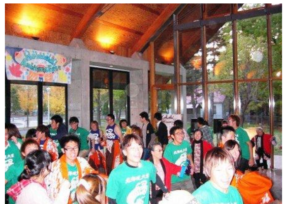
「健康リズム会」と「縁」とのダンス

日頃幌北地区で活動している「健康リズム会」とよさこいチーム「縁」とのダンスは熱気にあふれ、地域の方のバンド演奏と学生パフォーマー[縁&「Kazue & Peach boys」]のコラボステージで出演者も観客も多いに盛り上がりました。又、「市民交流カフェ」では、写真などが展示され、皆さん観賞したり、お茶を飲みながら談話するなど楽しいひと時を過ごしました。