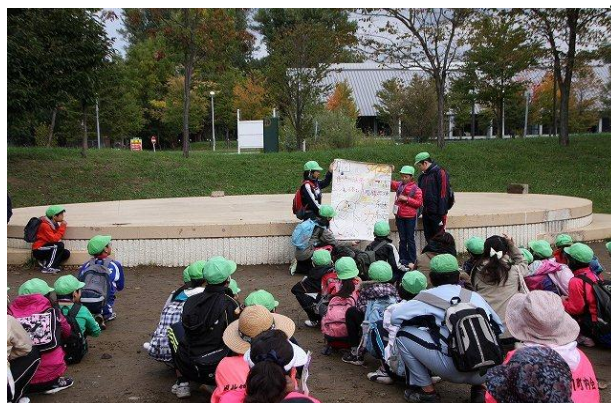
児童によるウォーキングの仕方の解説