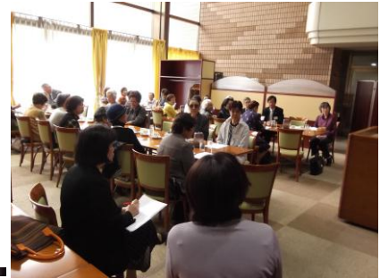
第8町内会の気軽にお茶の会