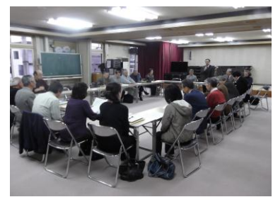
幌北会館運営委員会総会