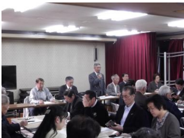
幌北連合町内会総会

幌北連合町内会の総会は5月12日（土）に幌北会館集会室にて開かれ、各町内会や関係団体の代表の方などの出席のもと、前年度事業報告・収支決算が承認されるとともに、今年度の事業計画や予算などが決定されました。