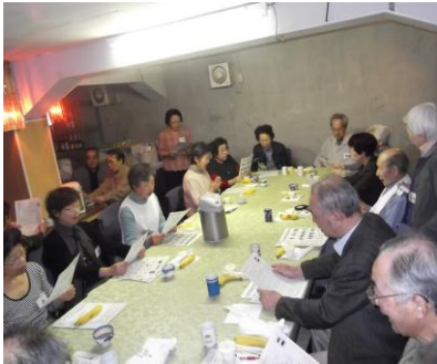
第1町内会の友楽クラブ