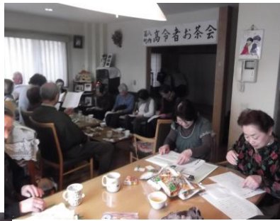
第8町内会のあやめ会