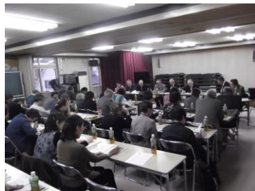
幌北地区社会福祉協議会総会