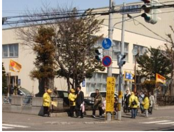
新入生たちを見守る様子

4月6日（水）の新入学児童登下校時に、幌北小学校周辺で交通安全街頭啓発が行われ、幌北交通安全実践会と幌北交通安全母の会の皆さんが子どもたちの安全を見守りました。両団体の皆さんは5月2日（月）の新一年生集団登下校訓練にも参加しています。