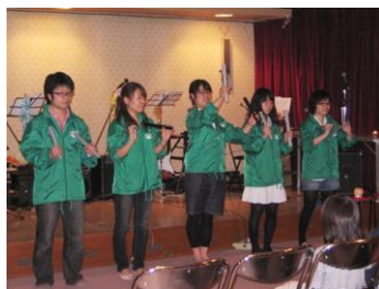
トーンチャイム演奏