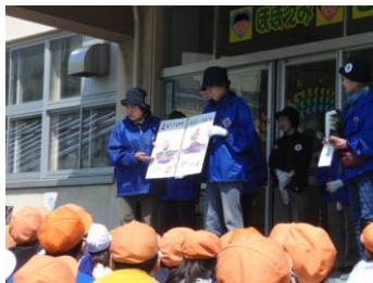
植え方を教えてもらう様子