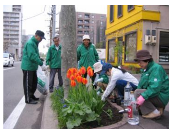
丁寧に作業していく様子

5月21日（土）・22日（日）、北区土木センターから花の提供を受けて単位町内会でます花壇での花植えを行いました。両日も学生と地域で考えるまちづくり会（NeoLos 幌北）のメンバーも参加しており、美しいまちづくりに花を添えました。