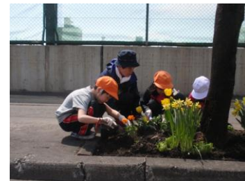
みんなで協力して植えていく様子