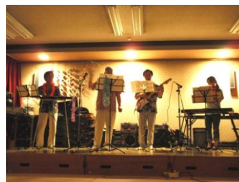
ハワイアンバンドの方々