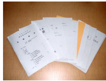
連町、単位町内会などの総会資料