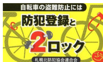
防犯登録カード表面