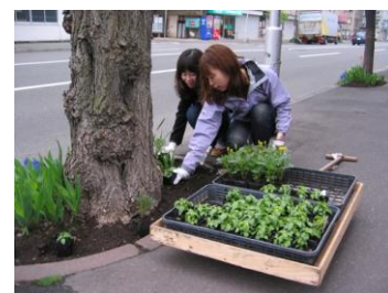
学生たちも作業中