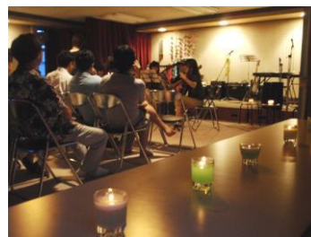
参加された方を照らす灯り