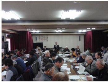
連合町内会総会の様子

各町内会や関係団体の代表の方などが出席し、平成22年度事業報告・収支決算が承認されるとともに、平成23年度事業計画や予算などが決定されました。