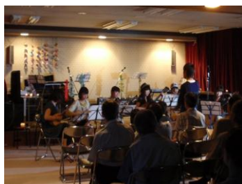
「アウロラ」の皆さん