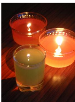
夏至の夜を照らす灯り

6月22日(水)午後7時から、幌北会館集会室でキャンドルナイトが催されました。キャンドルナイトとは、一年の中でもっとも日が長い夏至の夜に、みんなで一斉に電気を消してスローな夜をすごそうという全国的なイベントで、幌北地区では「学生と地域で考えるまちづくり会」(NeoLos(ネオロス)幌北)が中心となって今回初めて開催されたものです。