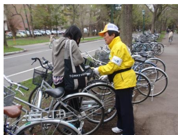
カードを手渡すすずらん隊

5月17日（火）には、「すずらん隊」の皆さんが、北海道大学の構内で学生たちに名刺サイズの黄色の防犯登録カードを手渡ししながら、自転車の盗難防止のための防犯登録とツーロック（カギを2つ付けること）を広めようと広報活動を行いました。