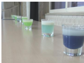
カラフルな廃食油キャンドル

そしてNeoLos 幌北の学生たちのトーンチャイム演奏で幕を開けた後、北海道大学チルコロ・マンドリニスティコ「アウロラ」や北海道大学ブルーグラス研究会のバンド「うたたね」、地域の方で結成するハワイアンバンド「ファミリーアイランダース」の皆さんによる多彩な音楽が演奏されました。参加した方々は素敵な音楽に耳を傾けながら、ゆったりとした時間をすごしていました。