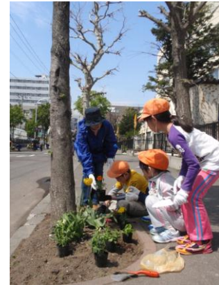
花植えをする児童たち

分団員の方から花の特徴や植え方を教えてもらったあと、3～4人のグループに分かれて実際の作業にあたりました。みんなで声を掛け合いながら可愛い花株をシ