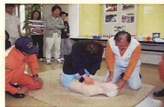
心臓マッサージ 人工呼吸