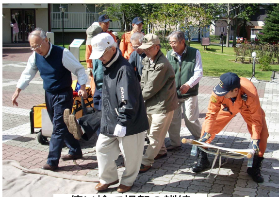
使い捨て担架の訓練